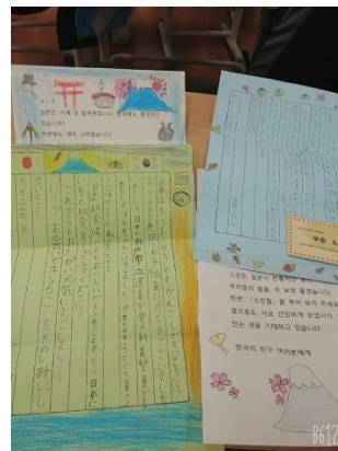
返事のお手紙には夏休みの出来事や秋の運動会のことなどが書かれています