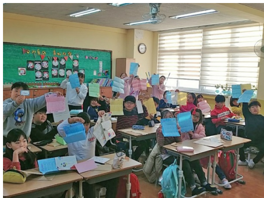
道泉小からお返事が届いて大喜び！

2019年夏以降、日韓関係が悪くなっていくなかで、道泉小学校の子どもたちから返事のお手紙がなかなか来なかったため、あきらめかけていましたが、2019年12月に道泉小学校の子どもたちからの待ちに待った返事のお手紙が届き、福昌小学校の子どもたちは大喜び！となりました。