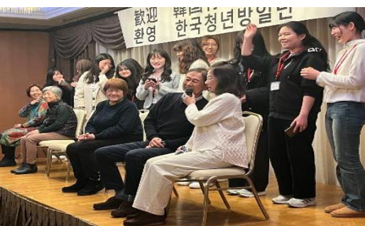
2024年1月15日【交流】 ホームステイ解散式