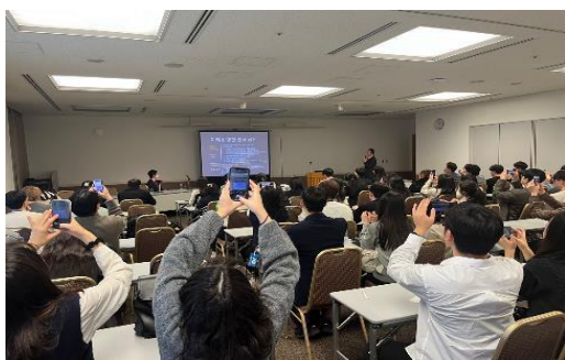
2024年1月10日【講義】 「最近の日韓関係について」