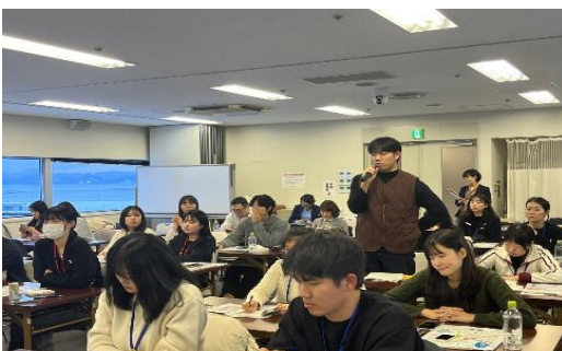
2024年1月12日【講義】 「地域×若者×企業 若者が挑戦できる町へ」