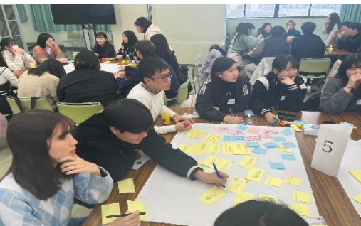
2024年1月15日【学校訪問・交流】 青森中央学院大学