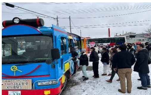
2024年1月13日【講義】 「地域で子どもたちを支え合う取組み」