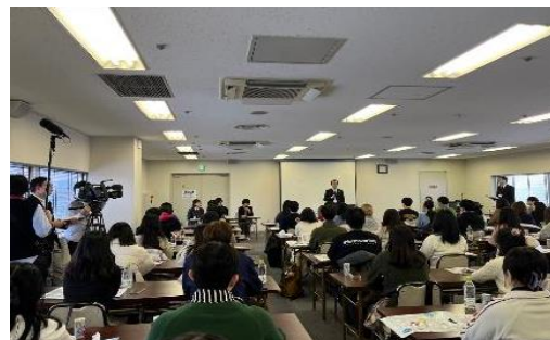
2024年1月12日【表敬・講義】青森県庁 「少子高齢化対策と地方再生への取組み」