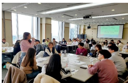
2024年1月11日【学校訪問・交流】 法政大学