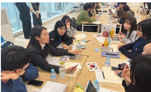
2024年1月11日【学校訪問・交流】 目白大学