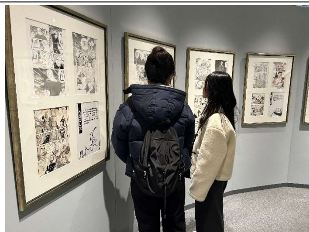
2023年12月19日【視察】手塚治虫記念館