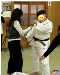
2023年12月19日 (Instagram) 오늘은 민항에 미니아시아에서 함께 여행해서 사진을 찍고 왔다. 점심으로 닭국 스테이크를 먹고 순채와 고등학생들이 방문해서 매우 친절하게 해 주었다. 순채 체험을 했다. 순채 체험이 너무 재미있어서 한참 동안 웃고 떠들고 있는 모습이 좋았다. 고등학교로 온 친구들과 같이 친해간 것 같아서 좋다. 그 후에 저녁을 먹으러 갔다가 친구들과 카페에서 모여서 과거 사진을 봤다. 추억이 너무 재

2023年12月19日 (Instagram) 淡路人形座で人形劇を鑑賞した。劇が始まる前にバックステージを見学する時間があったが、写真も撮ることができて楽しく説明していただいた。説明の中で人形座の方々の「誇り」のようなものを感じた。座員は長い期間修行をすると聞いたが頭は一生、足と手はそれぞれ7年かかるという。実際に演目を見てみると心から伝統を守ろうとしていることが伝わってきて素晴らしかった。