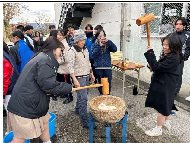
2023年12月18日【学校訪問】蒼開高等学校