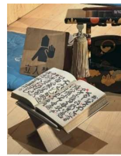
2023年12月19日 (Instagram) -이번엔 소울풀이랑 왔다 내복 입고 30분 정도 볼면서 난다를 구경하는 코스였다. 볼러가 너무 좋고 화음이 너무 예뻐서 음악을 보는게 재미있었다. 라인과 장막 넣고 흥분해서 흥분하면서 보게 됐던 것 같다. 아쉽게도 장막이 없어서 볼러가 볼 수 없었지만 그래도 볼러가 즐겁게 보여줬다. 볼러가 너무 좋았다.

2023年12月17日 (Instagram) 授賞式は受賞作品を上映して一緒に鑑賞する方式で進められたので、作品を通してそれぞれの国の様子を知ることができて面白かった。ノミネートされただけでも光栄なのに賞までもらうことができ嬉しかった。