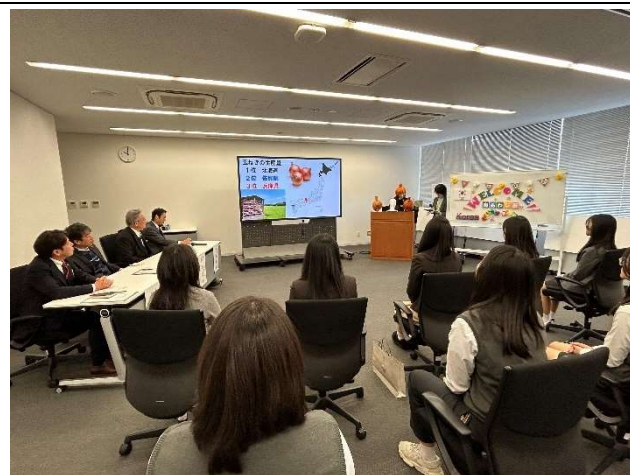
2023年12月18日【表敬】南あわじ市