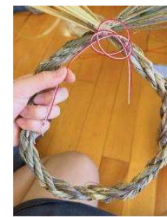
2023年12月19日 (Instagram) 오늘은 순채이 고등학교에 방문했다. 먼저 점심 식사를 한 후에 순채 체험을 했다. 순채 체험이 정말 재미있었다. 친구들이랑 같이 해서 한참 동안 웃고 떠들고 있는 모습이 좋았다. 그 후에 저녁을 먹으러 갔다가 친구들과 카페에서 모여서 과거 사진을 봤다. 추억이 너무 재

2023年12月19日 (Instagram) 蒼開高校を訪問し、しめ縄作りとお餅つき、部活動体験で柔道をした。とても楽しくて韓国でも柔道を習ってみたいと思った。日本人の友達とも親しくなれてとてもよかった。