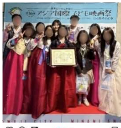
2023年12月17日 (Instagram) -오늘은 미니아시아에서 열린 시상식에서 수상했습니다 너무 영광이고 우리 팀의 사수에 의해 칭찬이 많아 감사드립니다 -특수공연이 있어서 그런지 흥분해서도 얼마 동안 흥분이나 감정을 이기고, 평소에도 같이 활동할 계획이었던 친구들 축하해주고 싶었습니다 -정식 식사 후에 드디어 본선 대회장에 왔습니다 -행복을 많이 기대합니다. 회장실에서 만난 분들이 너무 친절해서 기분이 좋았습니다. 이번 나날은 정말 뜻깊은 시간이었습니다. 감사합니다.

2023年12月17日 (Instagram) 授賞式は受賞作品を上映して一緒に鑑賞する方式で進められたので、作品を通してそれぞれの国の様子を知ることができて面白かった。ノミネートされただけでも光栄なのに賞までもらうことができ嬉しかった。