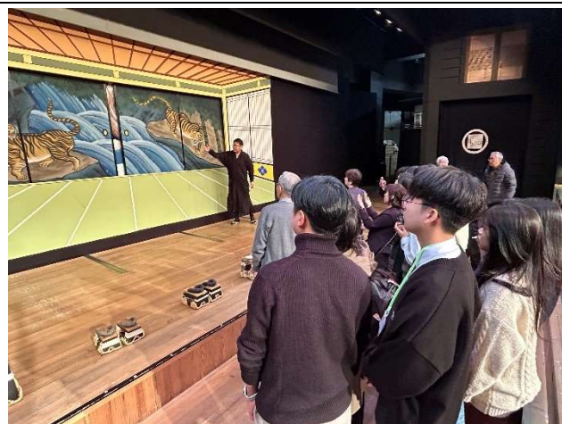
2023年12月17日【文化体験】淡路人形座