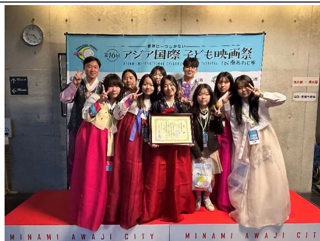
2023年12月16日 アジア国際子ども映画祭本選大会