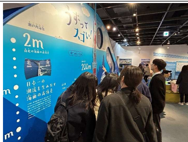
2023年12月17日【視察】うずしお科学館