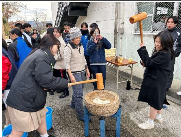
2023년 12월 18일 【학교방문·교류】 소카이 고등학교