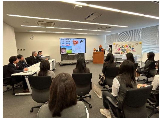
2023년 12월 18일 【예방】 효고현 미나미아와지 시