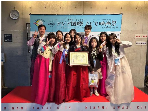
2023년 12월 16일 아시아국제학생영화제 본선대회