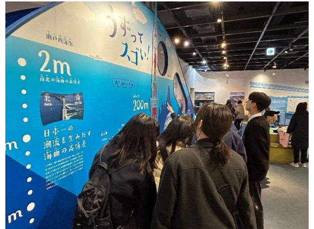
2023년 12월 17일 【시찰】 우즈시오 과학관