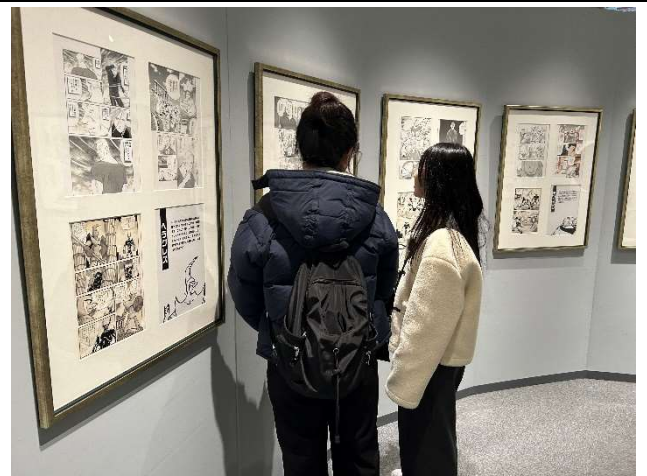
2023년 12월 19일 【시찰】 데즈카 오사무 기념관