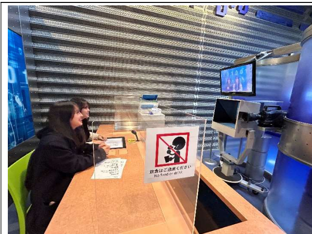
2023년 12월 20일 【시찰】 NHK 오사카 방송국