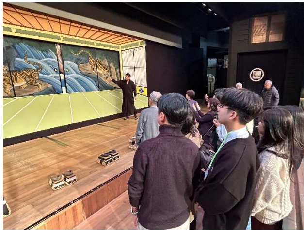
2023년 12월 17일 【문화체험】 아와지 닌교자