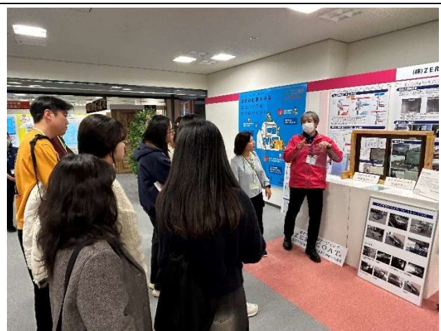
2023년 12월 20일 【시찰】 오사카환경산업진흥센터 오사카 ATC 그린에코 프라자